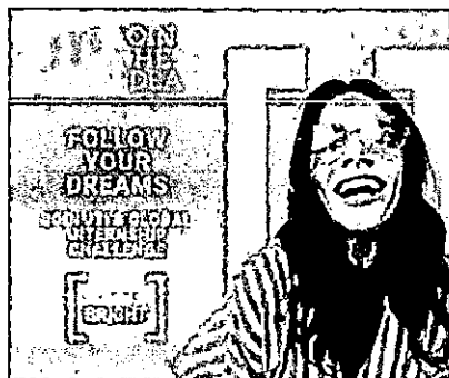
MIB 2021.jpg 53K