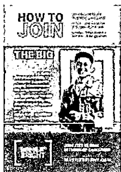
MIB 2021 (2).jpg 3200K